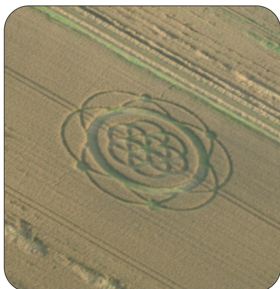
Diever: flower of life

En dan komen we op een ander merkwaardig feit: De stichting PTAH heeft sinds vorig jaar een graanveld waar we de nodige onderzoeken en proeven kunnen doen. Dit veld is door een boer beschikbaar gesteld. Een van de dingen die wij dit jaar wilden doen was een meditatie-experiment om te zien of we door middel van meditatie een cirkel zouden kunnen laten ontstaan. Na enkele vormen op papier gezet te hebben, kwamen we uiteindelijk uit op de afbeelding van de 'Seed of Life', niet te verwarren met de 'Flower of Life'.