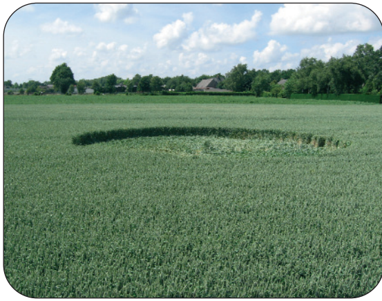
Hoeven - Noord Brabant 30-06-2005