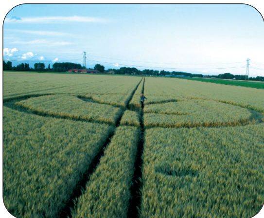
Zevenhuizen, Zuid Holland, 20-07-2005