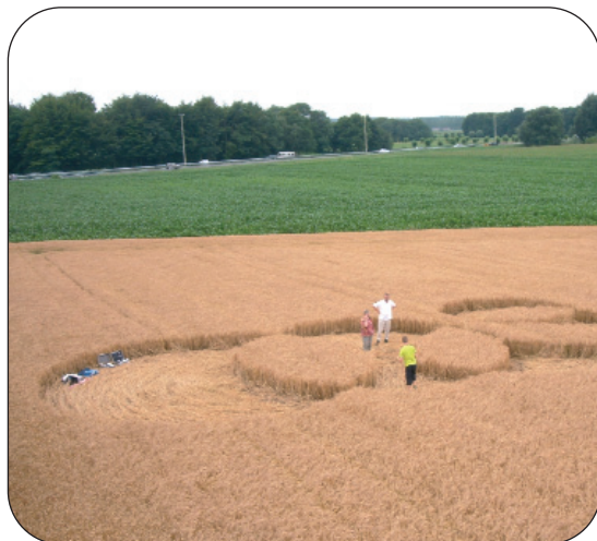
Een belabberde en zeer knullig uitgevoerde hoax. Veenendaal, Utrecht, 17-07-2005