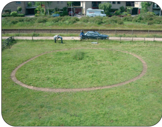
Doetinchem, Gelderland, 01-06-2005

gezien haar ervaring met paarden - deze ring absoluut niet door het longeren van paarden ontstaan was.