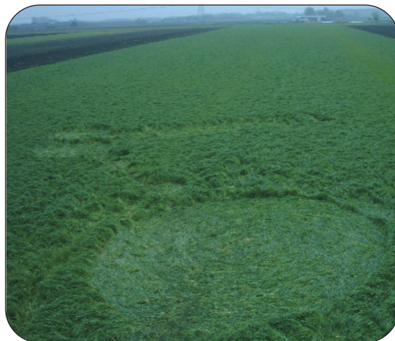
Hoeven, Noord Brabant, 06-04-2005