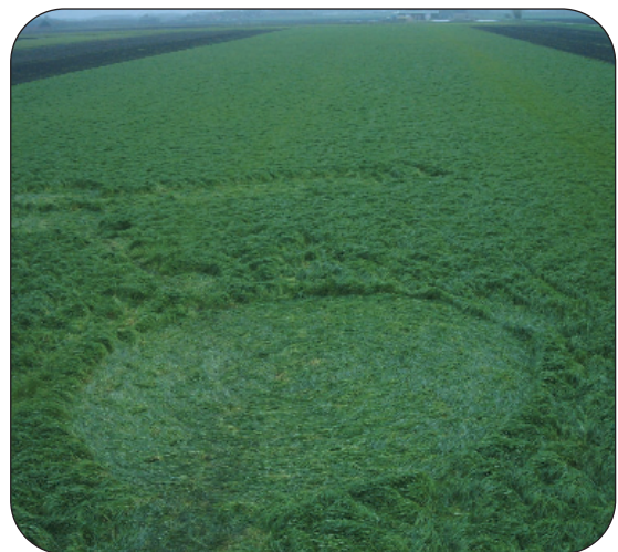
Hoeven, Noord Brabant, 06-04-2005